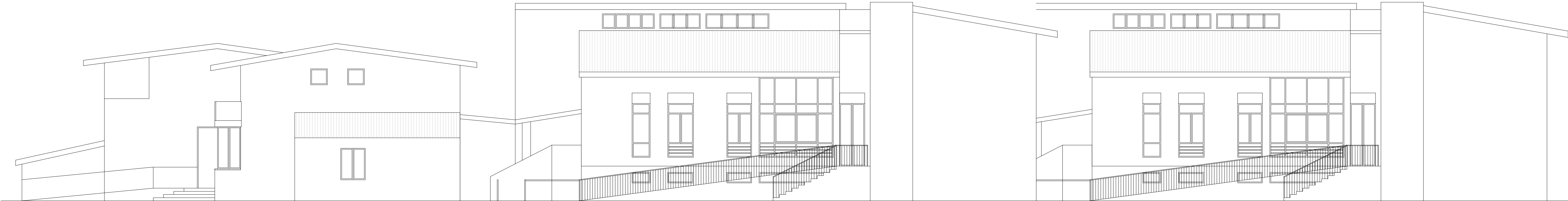
Prospetto Est_Scala 1:100