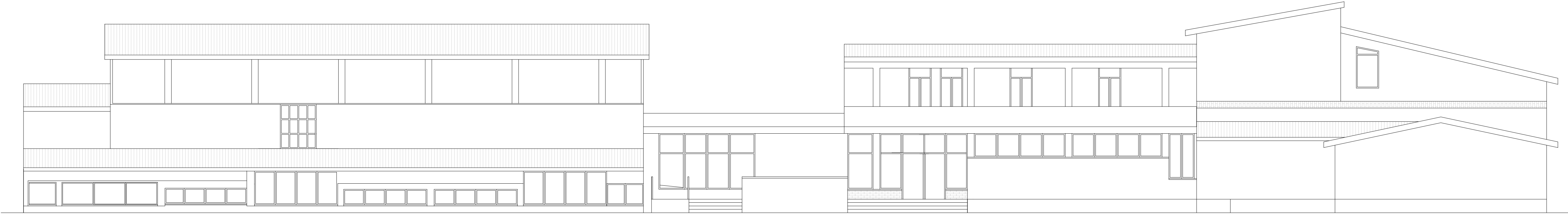
Prospetto Nord_Scala 1:100