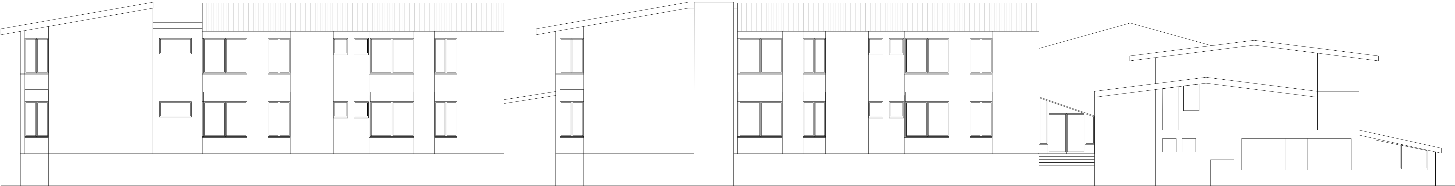
Prospetto Ovest_Scala 1:100